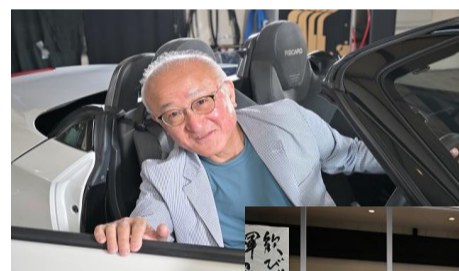
トヨタ GRコペン S様