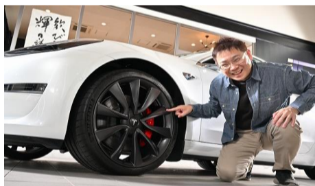
テスラ モデル3 A様