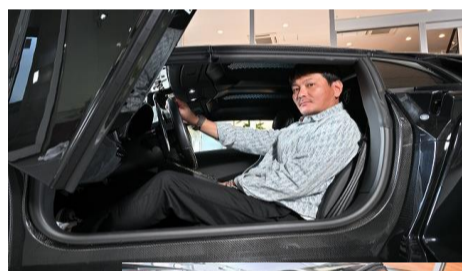
フェラーリ ポルトフィーノ ランボルギーニ アヴェンタドール空 O様

プロカメラマンが撮影した愛車との記念写真を一部ご紹介します♪許可を頂いたお客様のみ掲載しております。