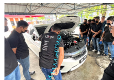
洗車の工程やエンジンルームのクリーニングを指導しました