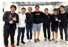
シングルポリッシャーを使用した場合の研磨のメカニズムを指導しました